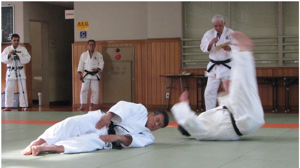
Le professeur Sato performant le cinquième élément du kata

Enfin, ce kata fait la gloire de l'emploi de l'espace et de notre capacité à s'adapter aux polarités des masses afin de choisir le moment opportun d'une initiative sans pour cela détruire l'autre.