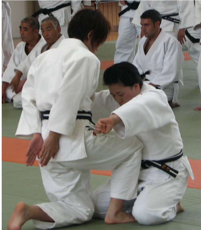
Pratique avec partenaire de Ryote Dori (Libération des poignets)