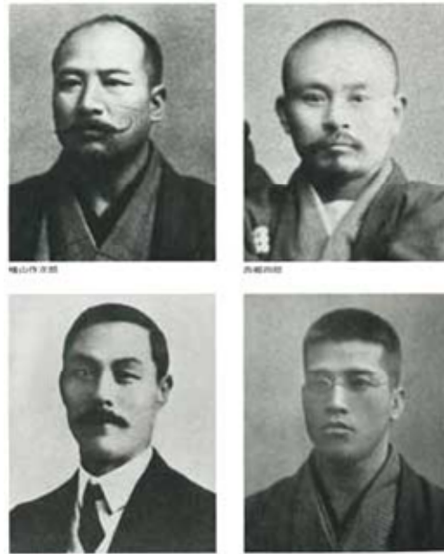
Les Quatre Piliers du Kodokan: Yokohama, Saigo, Tomita et Yamashita