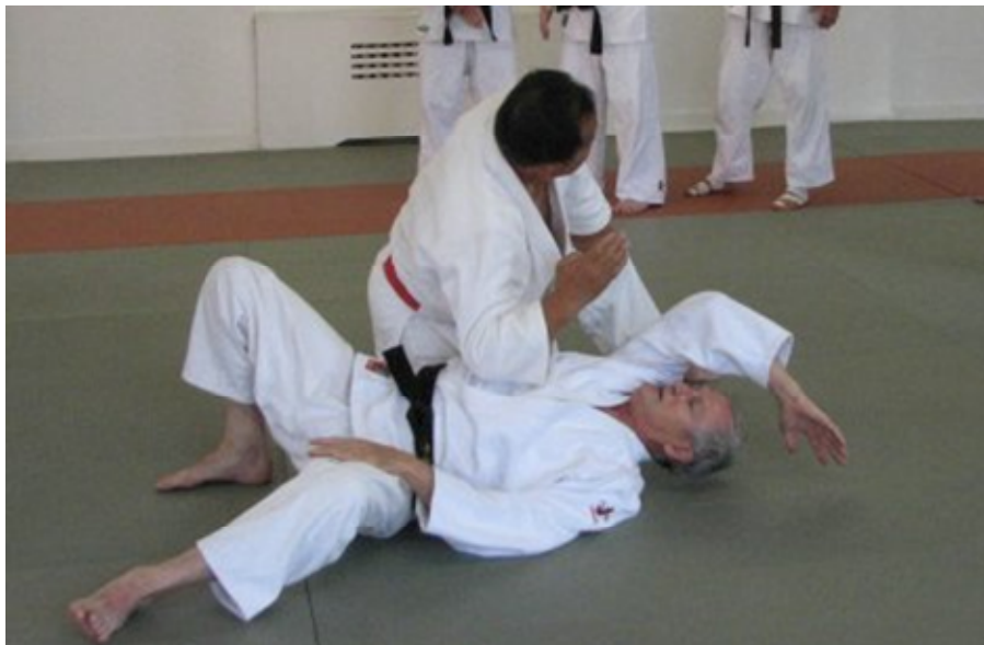
Professeur Fukushima démontrant la précision de l'atemi avec le coude

Les moments de décisions interviennent rapidement et la concentration est indispensable pour faire un temps d'arrêt nécessaire afin de juger de la sévérité de l'attaque, de déplacer son corps en conservant son équilibre et à rendre efficaces les défenses choisies, y compris la frappe avec des atémis portés vers des points vitaux choisis. À cause des armes utilisées, ce kata demande beaucoup de précision et concentration. Les attaques sont généralement rapides tandis que les parades et défenses sont décisives et précises. On y voit trois étapes spécifiques dans la défense : l'esquive, le coup frappé pour détourner et la maîtrise / soumission de l'adversaire.