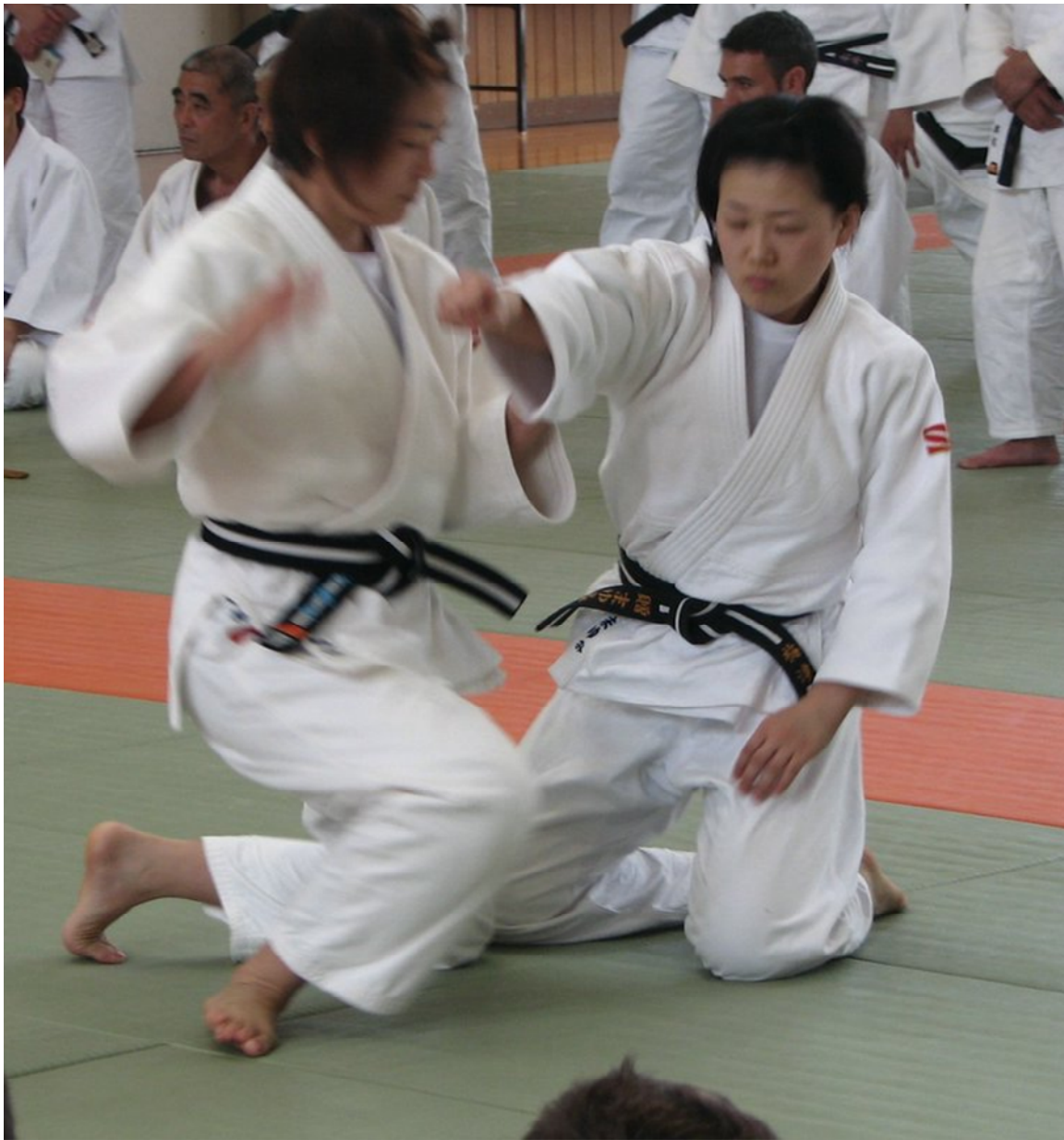
Riposte du Furi Hanashi pratiqué au Kodokan

Une cinquième technique de défense contre une attaque au poignard tenu à la ceinture porte le nom de Kiri Kake.