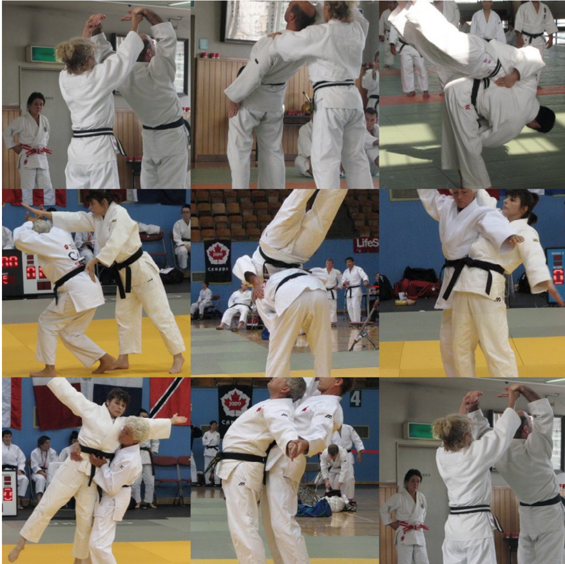
Divers segments de démonstration du Ju No Kata

« Il ne faut pas tenter de s'imposer, mais faire réfléchir et laisser libre d'agir »