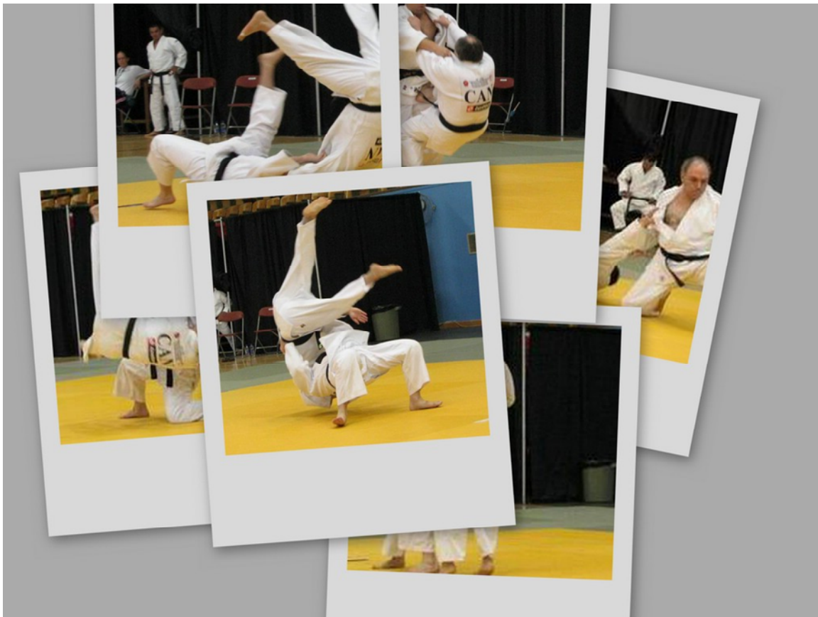
Composition d'une démonstration du Nage No Kata