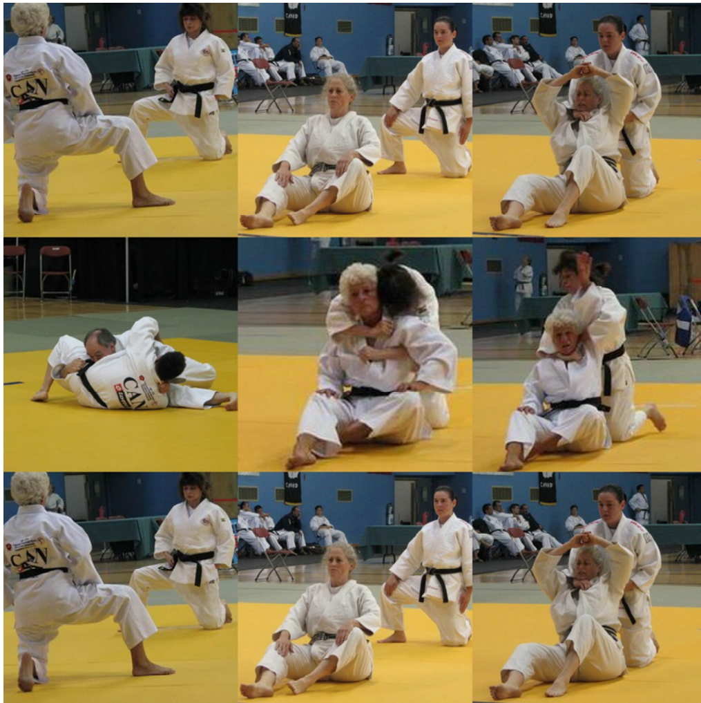
Quelques techniques du Katame No Kata exécutées au PanAm 2007