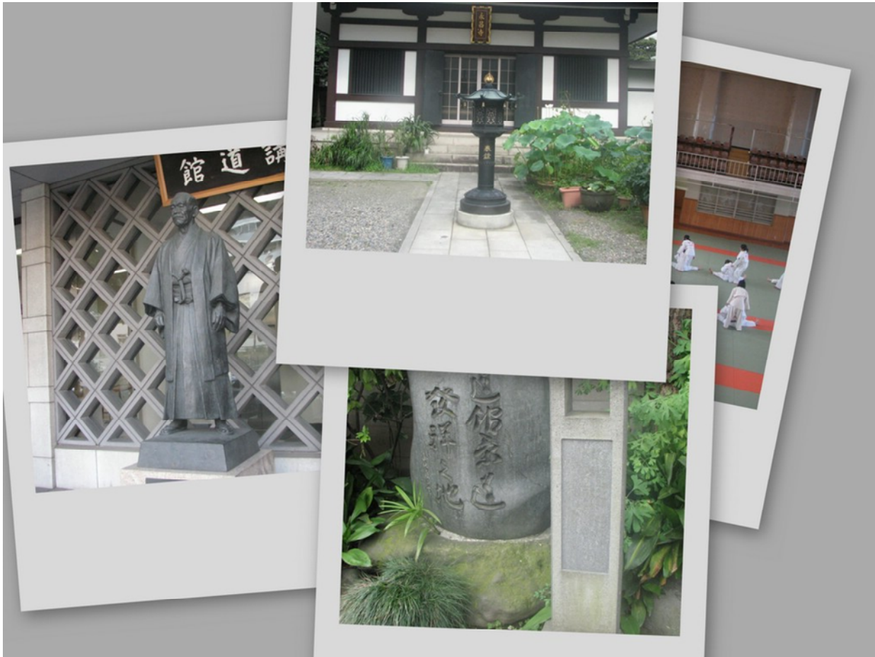
Le Kodokan du Maître Jigoro Kano à Tokyo

Le Maître Jigoro Kano a étudié et pratiqué plusieurs styles avec de grands experts de son temps mais à cause du décès plus ou moins hâtif de ces derniers, n'avait pas reçu tous les diplômes d'expertise dans ces styles et comme le voulait la tradition, ne pensait pas à propager sans autorisation, un style en particulier. Il voyait dans la pratique des arts martiaux plus qu'une technique ou un style particulier de combat et c'est peut-être ce qui le conduisit à nommer son institution Kodokan judo , à titre d'institution de haut lieu afin d'y refléter sa synthèse et son concept du développement moral.