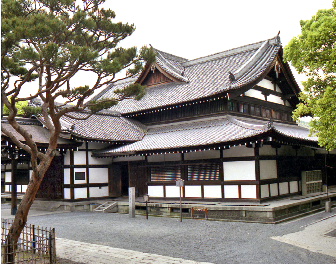
Le Butokuden de Kyoto tel qu'il apparaîtrait en 2000.

En 1895, le Maître Jigoro Kano est nommé chef de la commission de la standardisation des katas. Lui et son équipe de hauts gradés prennent une part active au développement des nouvelles normes ayant trait au kata de projection, (Nage No) de contrôle (Katame No) et de décision (Kime No).