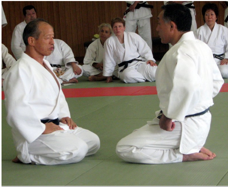
Positions assises pour saluer et exécuter

Dans cette prochaine section, nous aborderons les principales caractéristiques des katas du Kodokan.