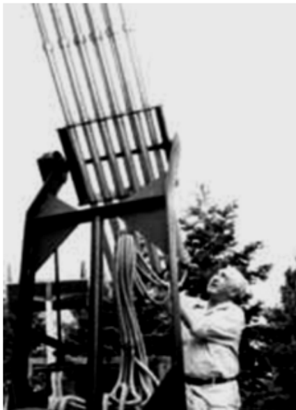
2. Le Cloudbuster de W. Reich