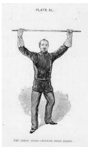
Française de tête