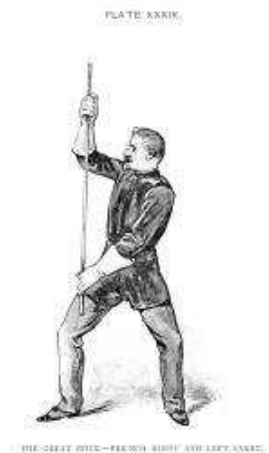
Française à gauche