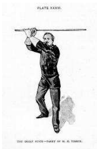
Tierce Haute Horizontale