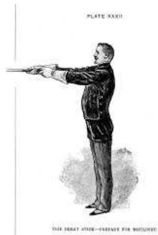
Préparation pour le moulinet