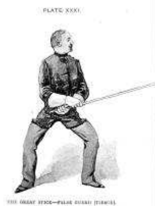
Tierce - Fausse garde