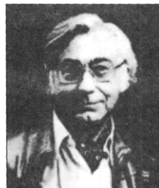
Jean E. Charon.