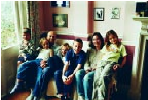
Flash ou pas de flash ? Une atmosphère théâtrale est obtenue dans ce portrait de famille en utilisant la lumière naturelle venant de la fenêtre.