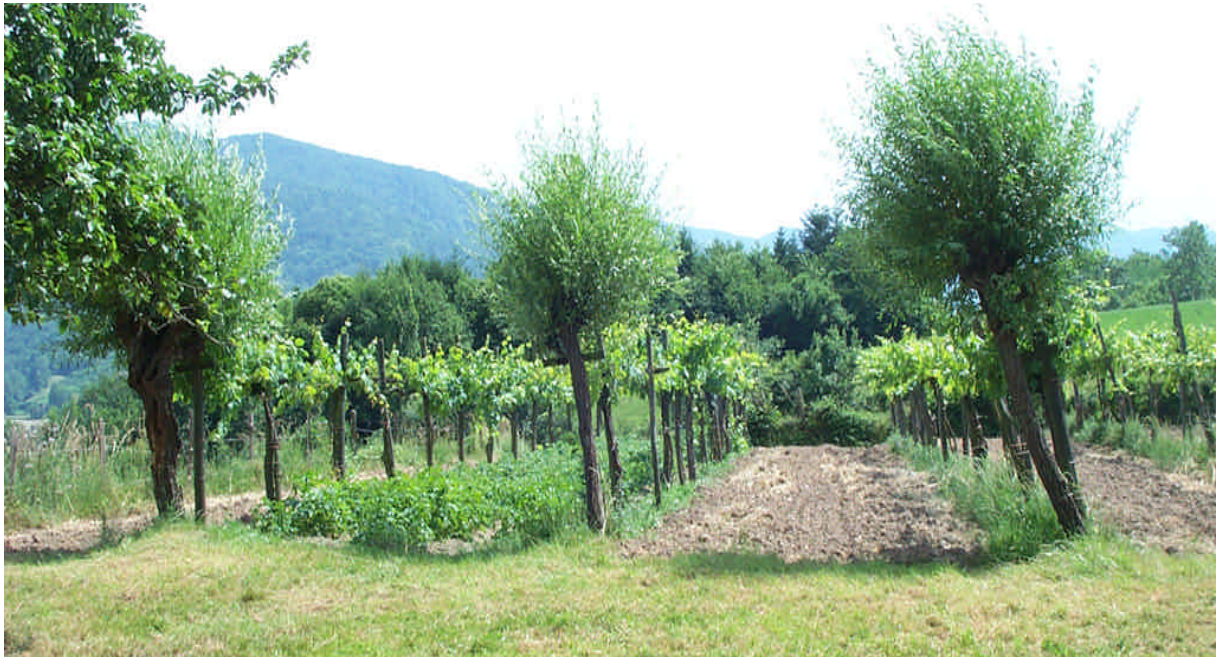
Hautains de vigne du Comminges