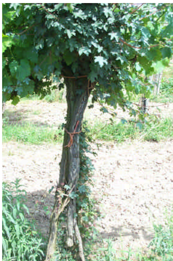
2 ceps de vigne par érable ( acer campestre )

Liée à un tuteur, la vigne est incitée - pour ne pas dire contrainte et forcée - à prendre de la hauteur pour dégager de l'espace au sol. En éloignant les grappes de raisin du sol, on les protège en automne de l'humidité des matins frais. Il s'agit dans les régions naturellement peu propices à la vigne, de gagner en maturité et en qualité du vin.