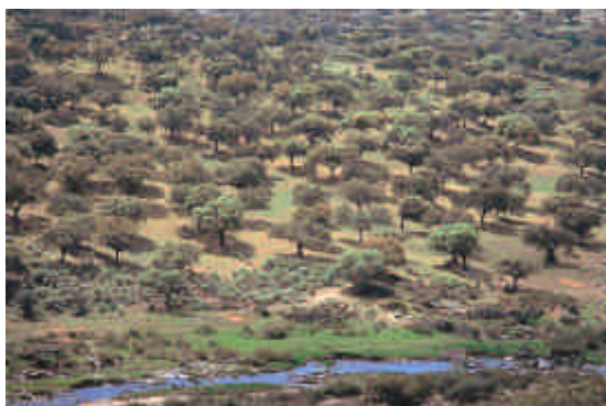
Extremadure (Espagne) : Les chênes verts et pubescents cohabitent avec les animaux et les cultures

La dehesa en Espagne - ou montados au Portugal - constitue une forme mature d'agriculture en zone sèche et soumise à un fort stress hydrique aux étés longs et secs du climat méditerranéen, aux hivers froids et humides. Ces paysages arborés partagent avec les oliveraies le fait d'avoir traversé deux millénaires sans bouleversements majeurs. Ils valorisent les sols peu fertiles, avec très peu d'intrants. Jusqu'à ce jour, rien d'aussi merveilleusement adapté à ces contrées arides n'a été trouvé. Les plus belles sont situées en Extremadure (Espagne) et en Alentejo (Portugal). Ces espaces sont d'une grande richesse biologique (aigle impérial, pie bleue ...).