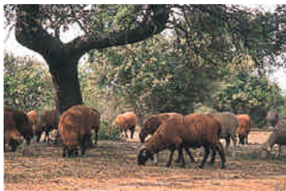
Moutons merinos noir pâturent dans la dehesa de chênes verts avant la transhumance

sèche) est faible mais plus élevée que dans les steppes du fait de l'ombrage des arbres. Le liège, le bois de chauffage, le charbon de bois et la chasse assurent aussi un revenu important. Les arbres sont régulièrement taillés en parasol et une partie de la dehesa est mise chaque année en culture en céréales d'hiver - blé, orge, avoine - dans le cadre de rotations qui laissent chaque pan de montado en repos plusieurs années consécutives.