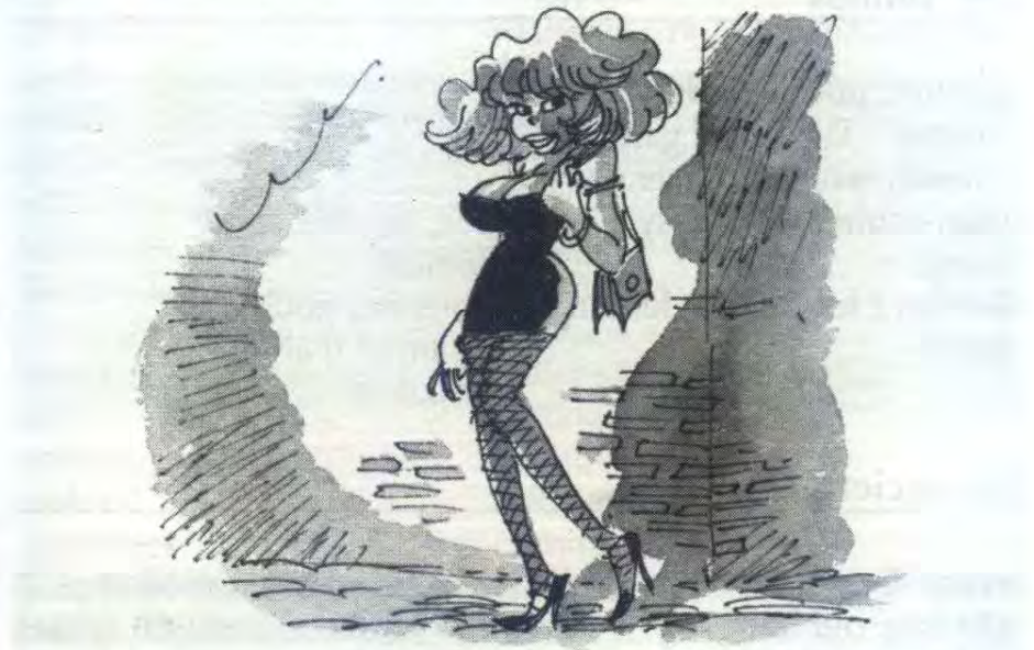
DUMB BLONDE (blonde vaporeuse)