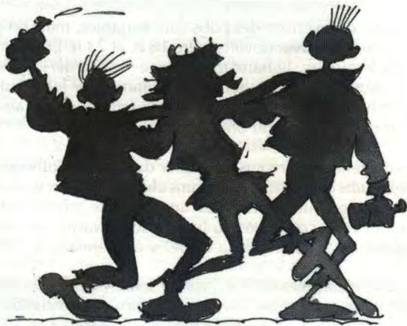
PUB CRAWLING (tournée des bars)