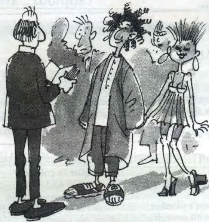
WALKING DOWN THE AISLE (Passage devant M. le curé)

Ainsi se termine l'évocation argotique de ce qui a animé, anime et animera encore longtemps, en concurrence avec l'argent, des dizaines de générations des cinq continents.